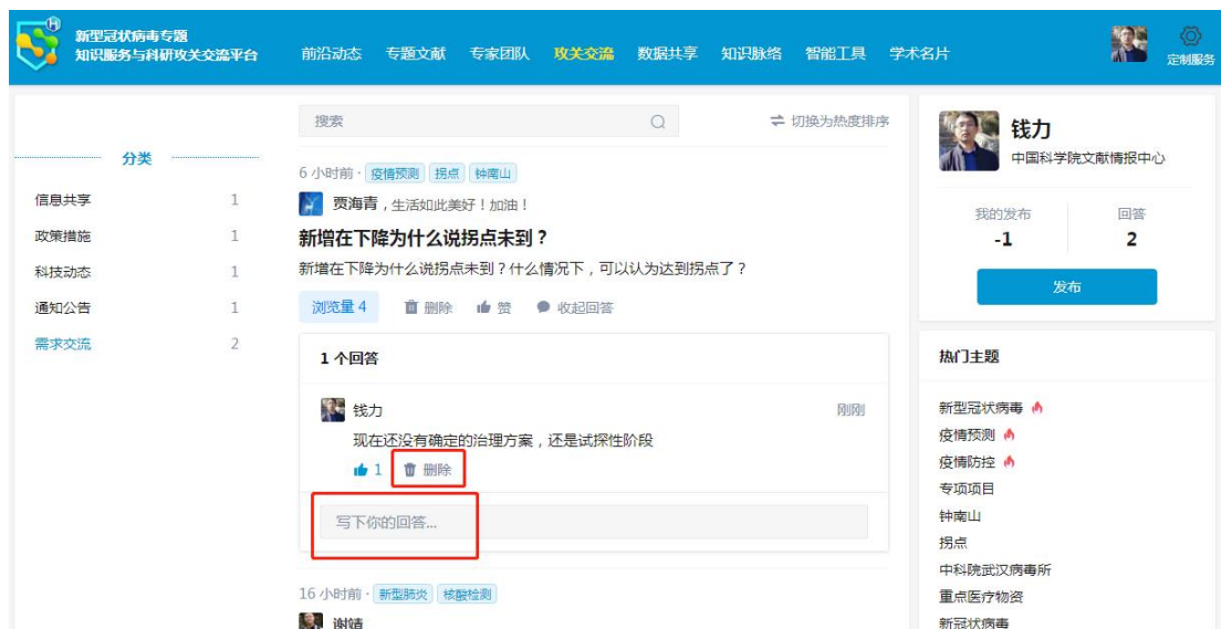
图 7 交流跟帖页面

第三步：点击左侧“需求交流”分类，可以对每一条信息进行交流回答，即点击“回答”按钮，同时也可以删除自己回答的评论（见图 7）