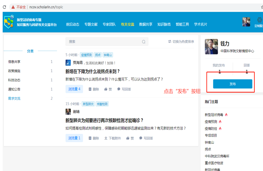
图 5 “攻关交流”主页