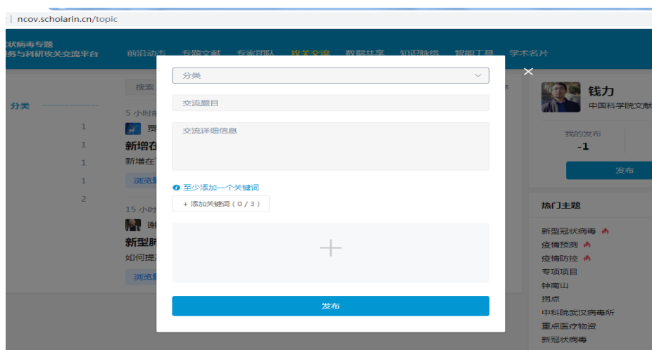
图 6 内容发布页面