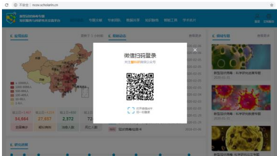
图 1 微信扫码