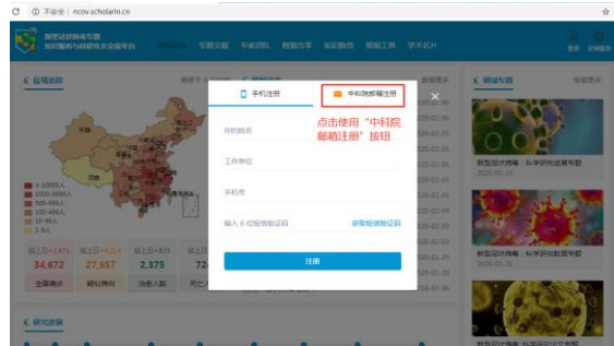
图 2 选择中科院邮箱注册