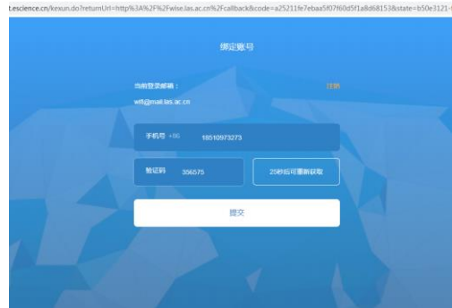
图 4 邮箱绑定手机号